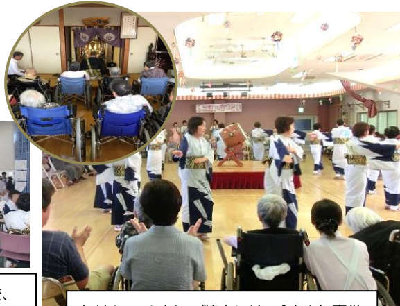
たくさんのおみなさまのご協力により、今年も無事供養ができました。心からお礼申し上げます。