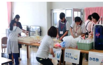
大盛況飲食コーナー。尾道福祉専門学校、総合技術高校のボランティアのみなさん。ありがとうございました。